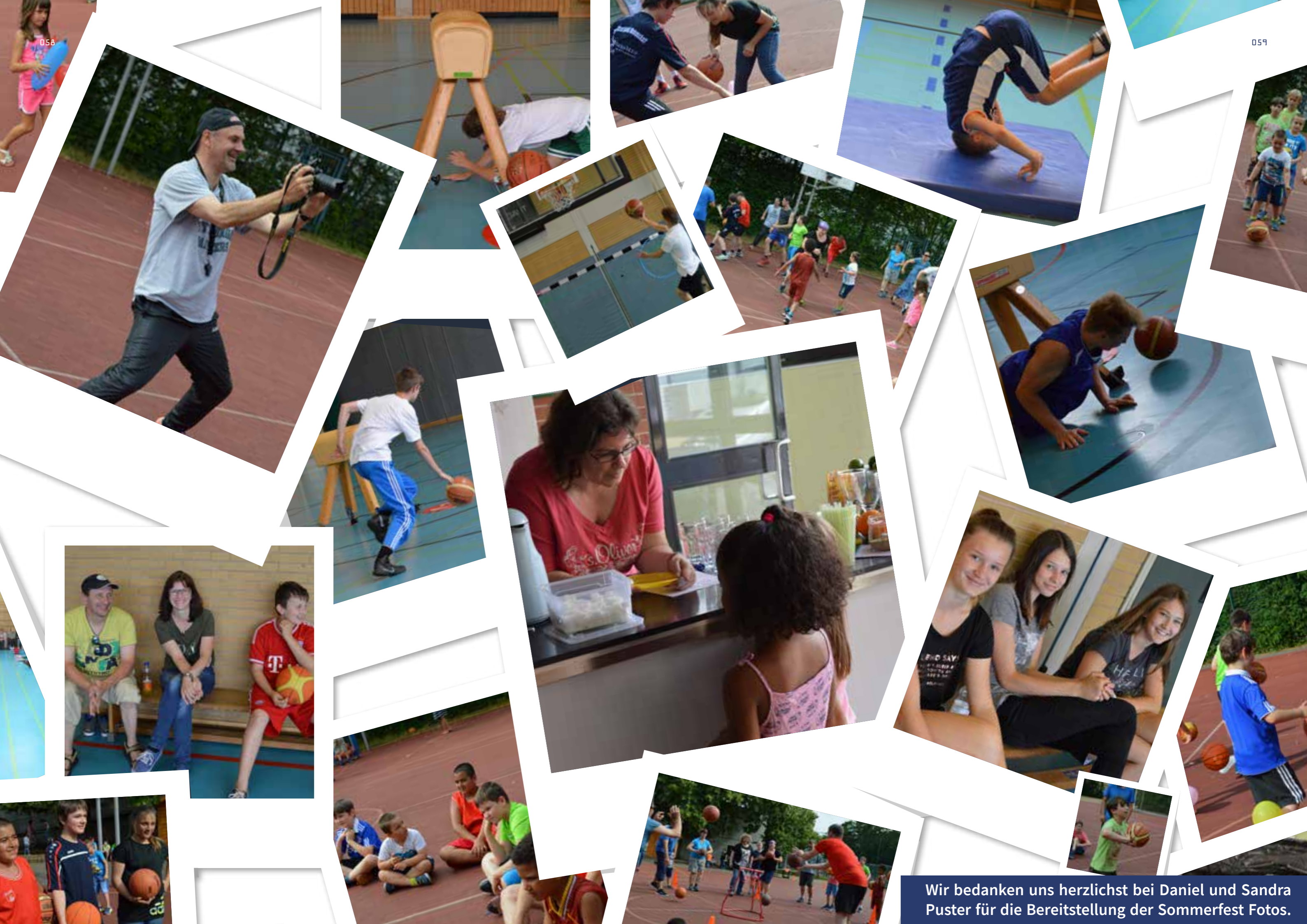
Wir bedanken uns herzlichst bei Daniel und Sandra Puster für die Bereitstellung der Sommerfest Fotos.