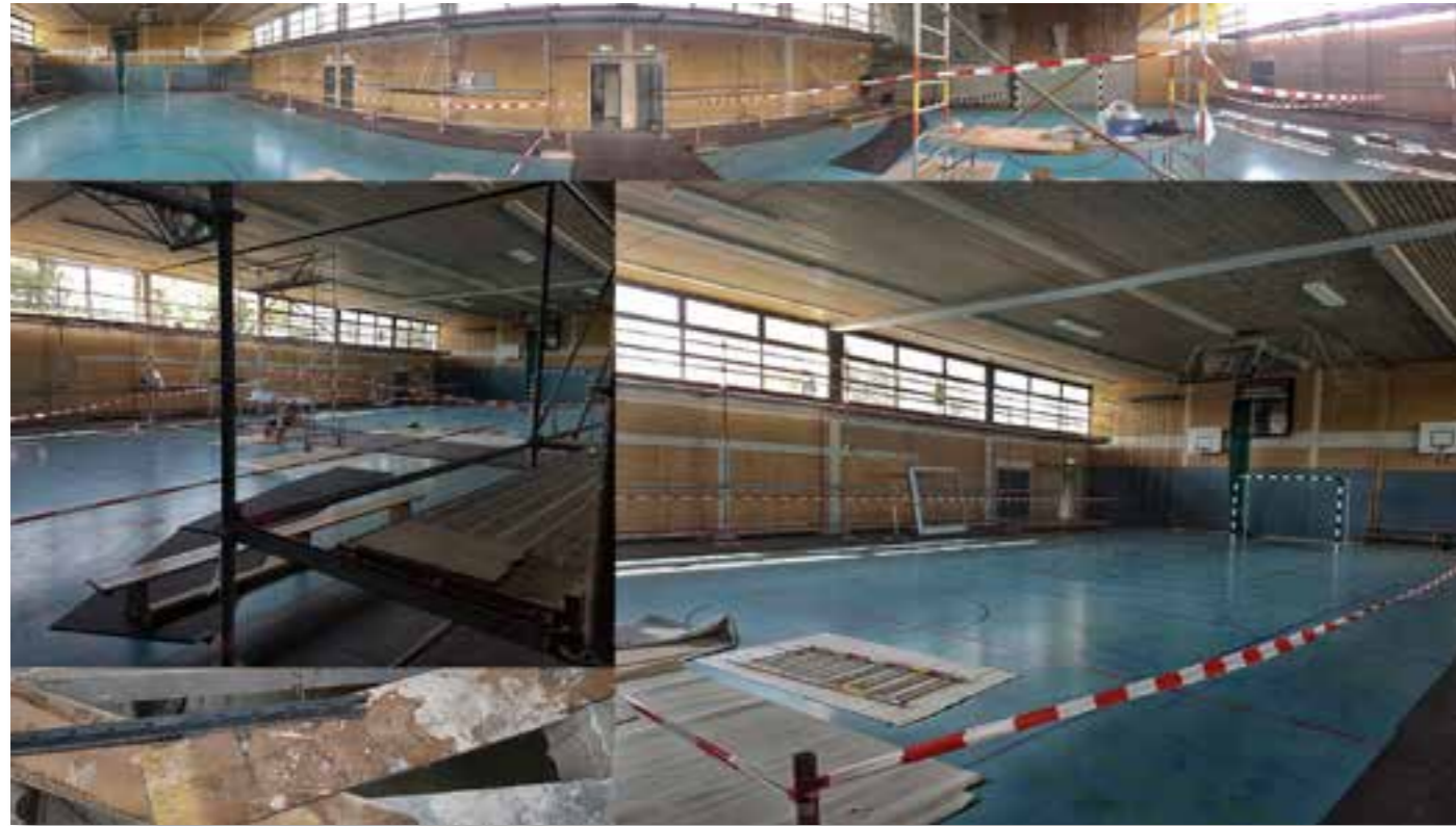
HALLENUMBAU DER FRÖBELSCHULE