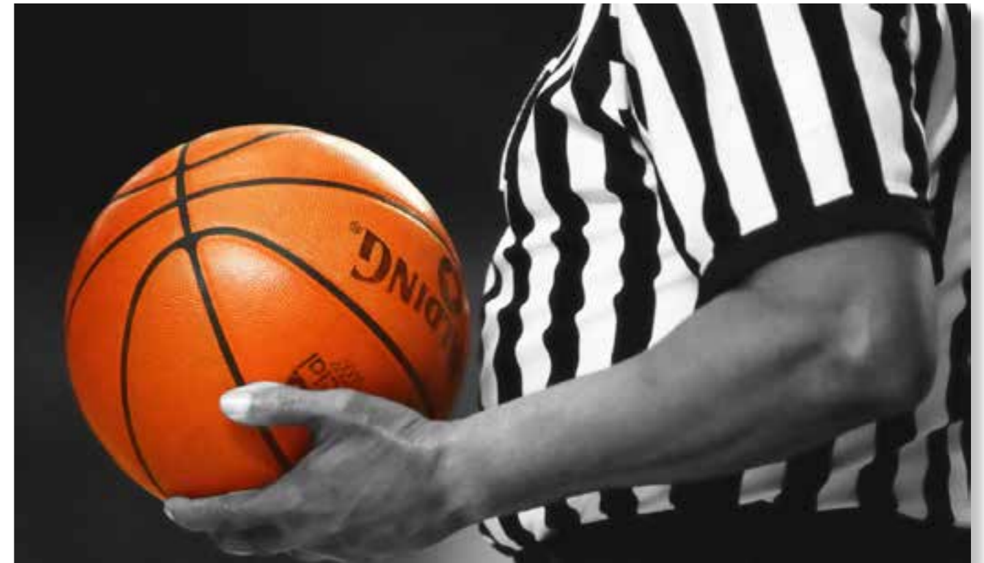
DIE PFEIFE STETS PARAT